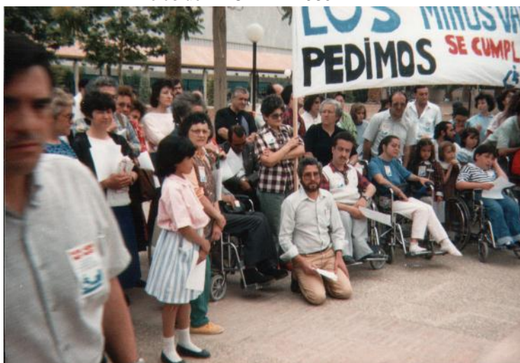
Inicios de AMUPHEB 1980

Desde 1983 AMUPHEB cuenta con profesionales dedicados al desarrollo de las actividades de la Asociación, pero nunca ha descuidado su parte voluntaria y de participación social, teniendo desde sus inicios un funcionamiento democrático y participativo.